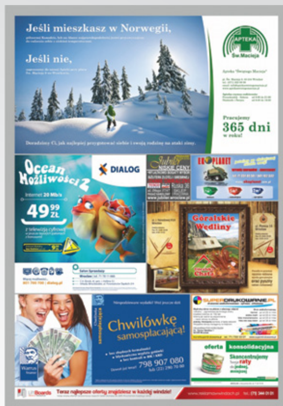
wizualizacja nośnika Liftboards

“ Po kilku miesiącach widoczny był już efekt reklamy, przynoszący znaczny wzrost sprzedaży usług w rejonie, w którym wisiały tablice. W windach reklamujemy się nieprzerwanie, dzięki czemu obserwujemy dalszy wzrost zainteresowania naszymi usługami.